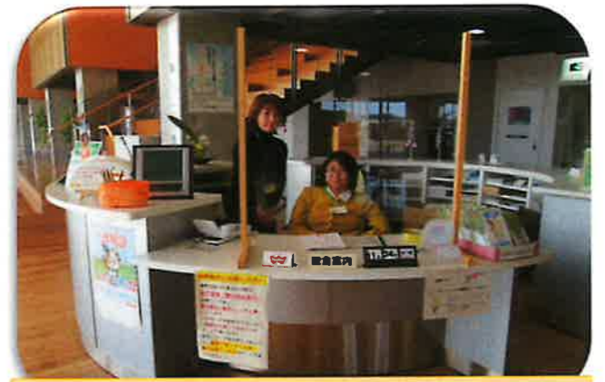
川越町役場での受付（施設外就労・支援）