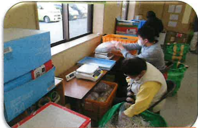
緩衝材（袋詰め作業）