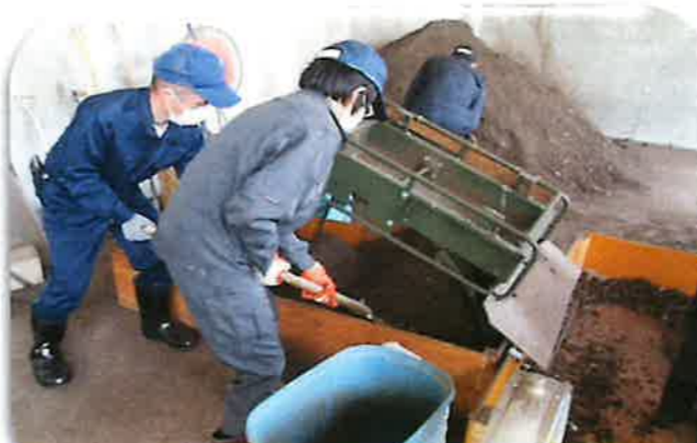
クリーンセンターでの堆肥作業（施設外就労）