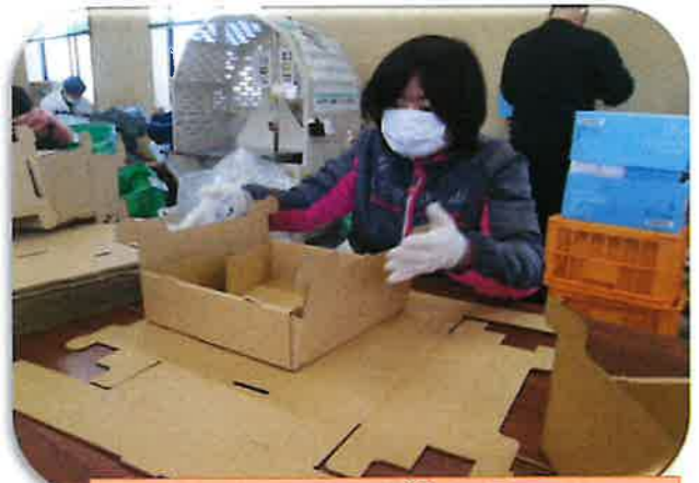
いちご箱の組み立て