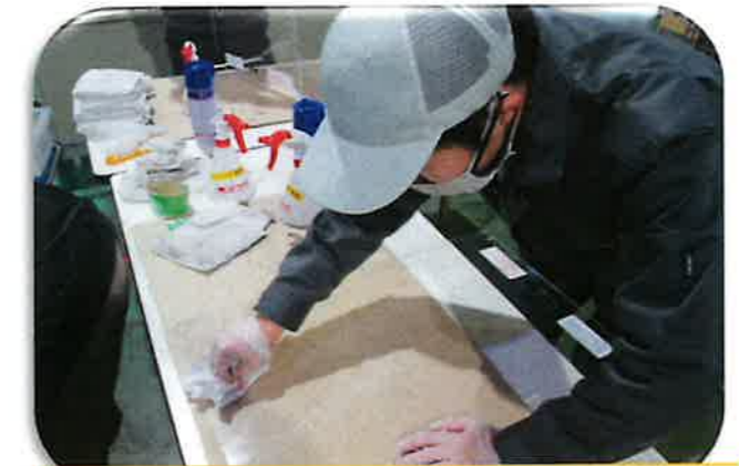
フライド物流での清掃作業（施設外就労）