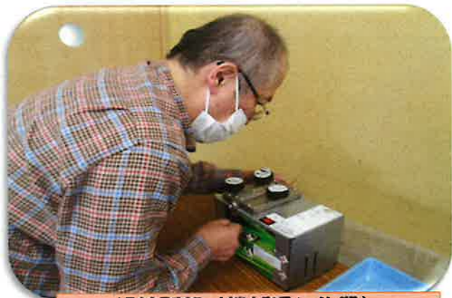
銅線剥離（機械通し作業）