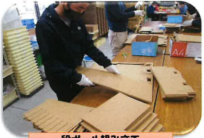
段ボール組み立て