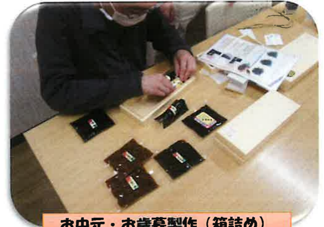
お中元・お歳暮製作（箱詰め）