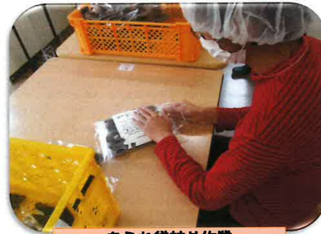
あられ袋詰め作業